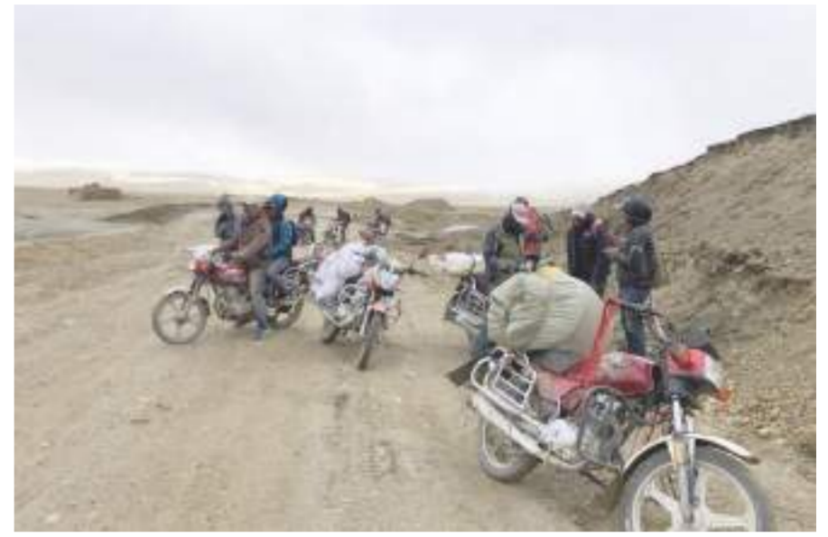
अन्तरदेशीय व्यापार मेला स्थल कोरला नाकाको चिनियाभूमिमा उपल्लो मुस्ताङका युवा ।