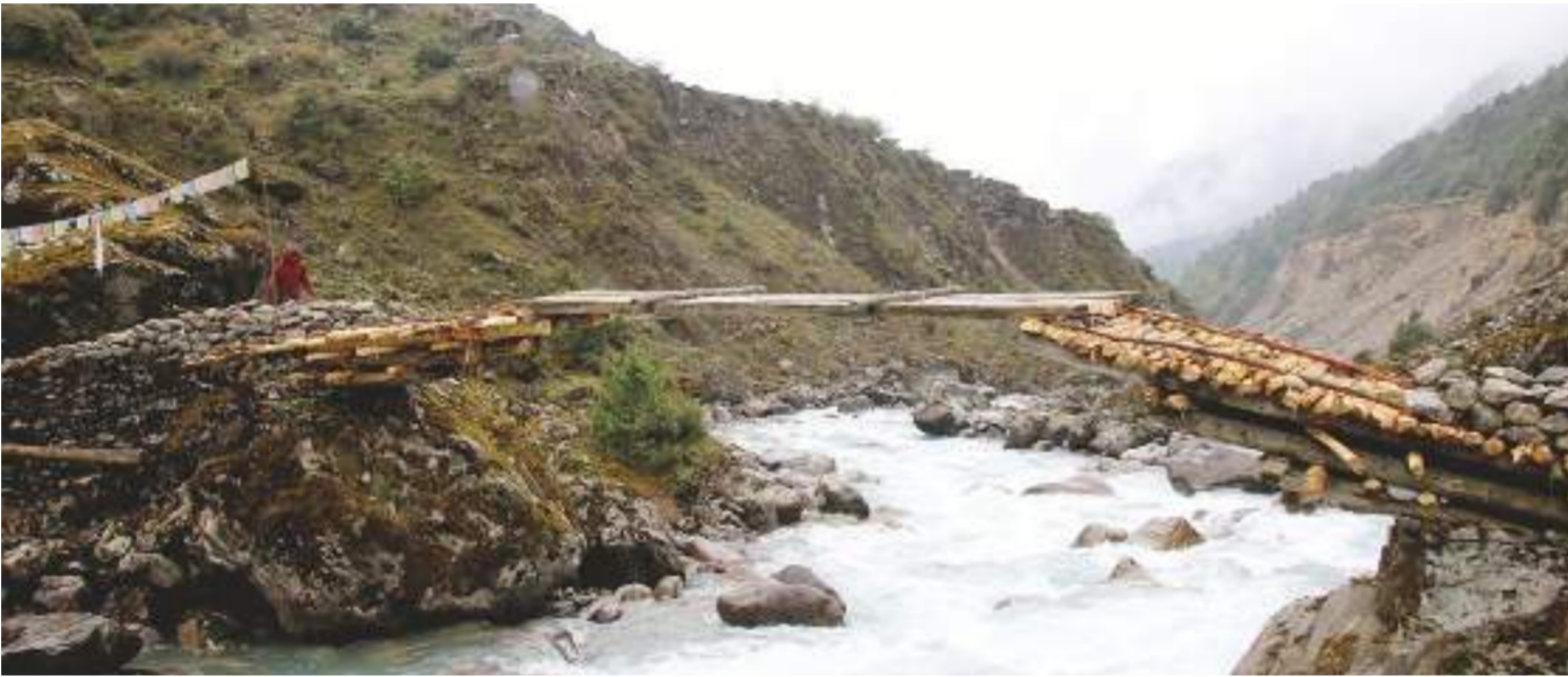
ताप्लेजुङको हिमाली क्षेत्र ओलाङ्चुङगोलामा तमोर नदीमाथि स्थानीयले बनाएको फड्के । पुलको व्यवस्था नहुँदा स्थानीय यसरी जोखिम मोल्न बाध्य छन् ।

मुख्य सडक सुन्धारस्थित धरहरा, दरबार हाइस्कूल, रानीपोखरी र बसपार्कमा विभिन्न स्थानबाट आएका सवारी साधनले ल्याएका हिलो माटोका कारण सफा गर्न समस्या भएको महानगरको वातावरण विभागले जनाएको छ । कानुनी रूपमा ८ मिटरभन्दा कम चौडाइका सडकमात्र महानगरको जिम्मेवारीमा पर्छन् भने अरु सडक विभाग मातहत पर्छन् ।