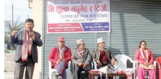
समाधान संवाददाता पोखरा, ३० कार्तिक

जनसक्रिय टोल विकास संस्था पोखरा १४ ले विश्व मधुमेह दिवसको अवसरमा शिविर आयोजना गरेको छ । टोलले आयोजना गरेको शिविरमा १ सय ७४ जनाको सिस्तेमा जाँच गरिएको छ ।