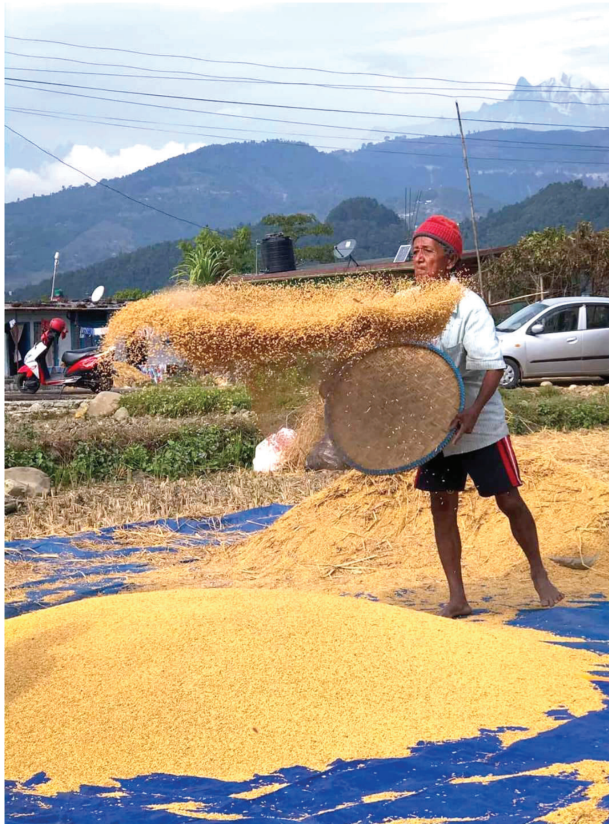
दाईको चटारो : पोखरा ३१ वेगनासस्थित त्रिकाड फाँटमा शनिबार धान बताउने क्रममा छर्ना (जाली) हान्ने १ किसान।