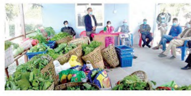
समाधान संवाददाता पोखरा २२ कात्तिक