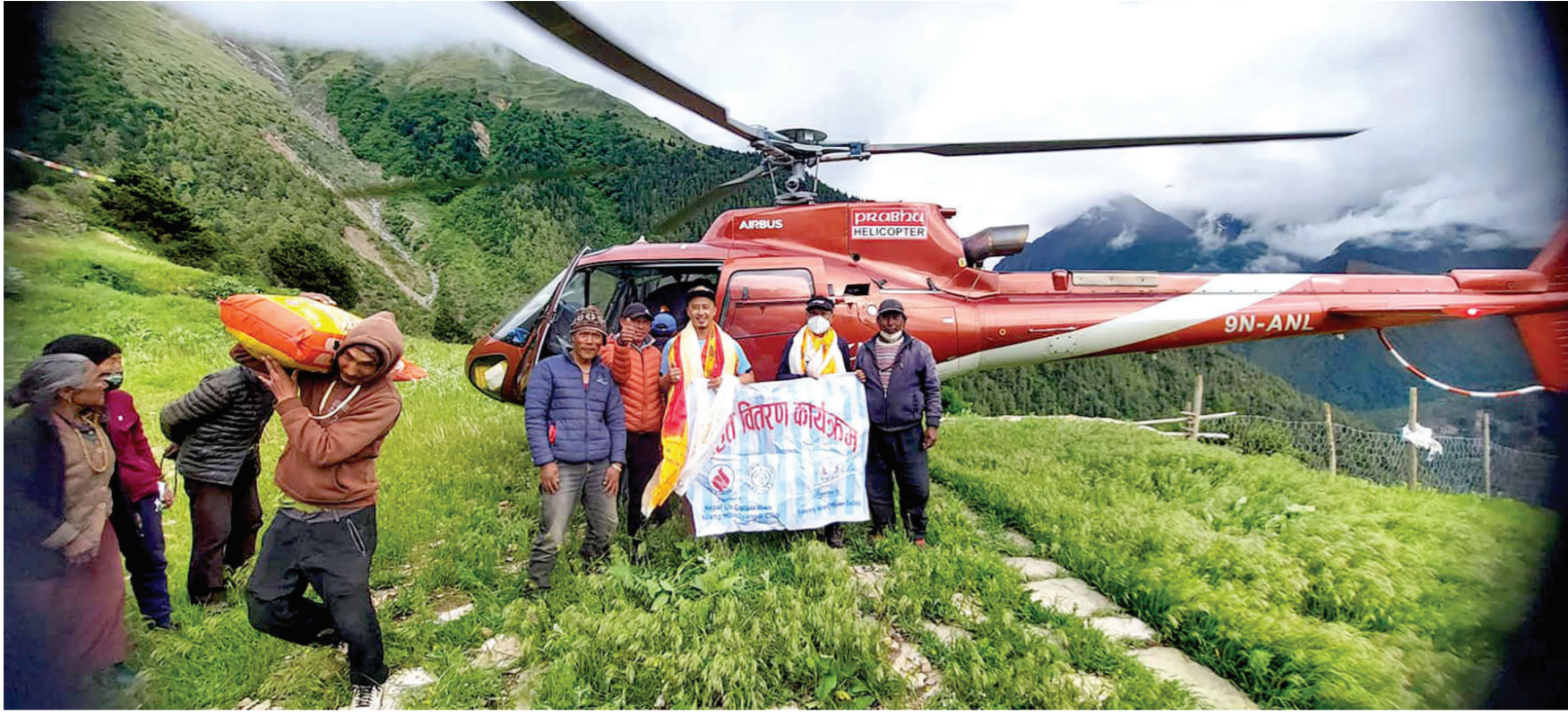
मनाङ मर्स्याङ्दी क्लबका प्रतिनिधिबाट मनाङका बाढी-पहिरो पिडितलाई राहत सामग्री वितरणपछि राहत बोक्दै पिडित। क्लबले जिल्लाको डिस्ट्याड गाउँपालिकाका बाढीपिडितलाई त्रिपाल ओषधि, खाद्य सामग्री वितरण गरेको छ।