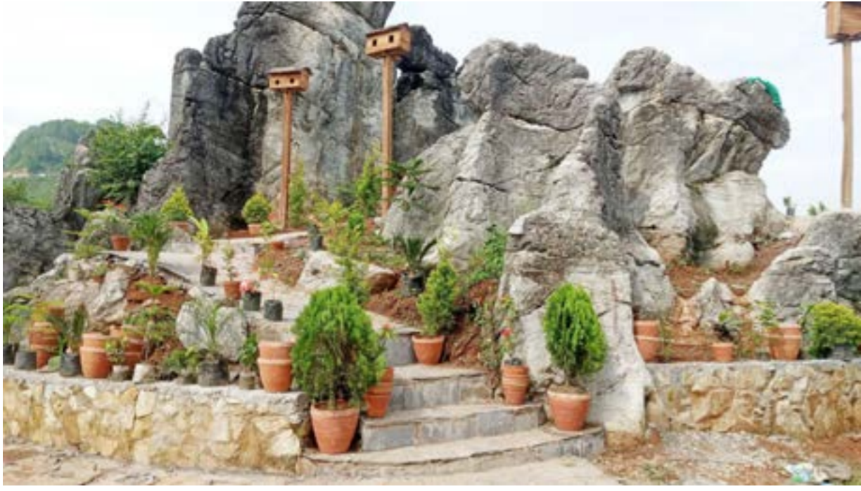
तनहुँको भिमाद नगरपालिका-९ मोहरियास्थित 'घाङ्च ल्हुम (अग्लो दुङ्गा) मा निर्माण गरिएको उद्यान। गण्डकी प्रदेश सरकारको सहयोगमा यहाँ पूर्वाधार निर्माण गर्न लागिएको छ।