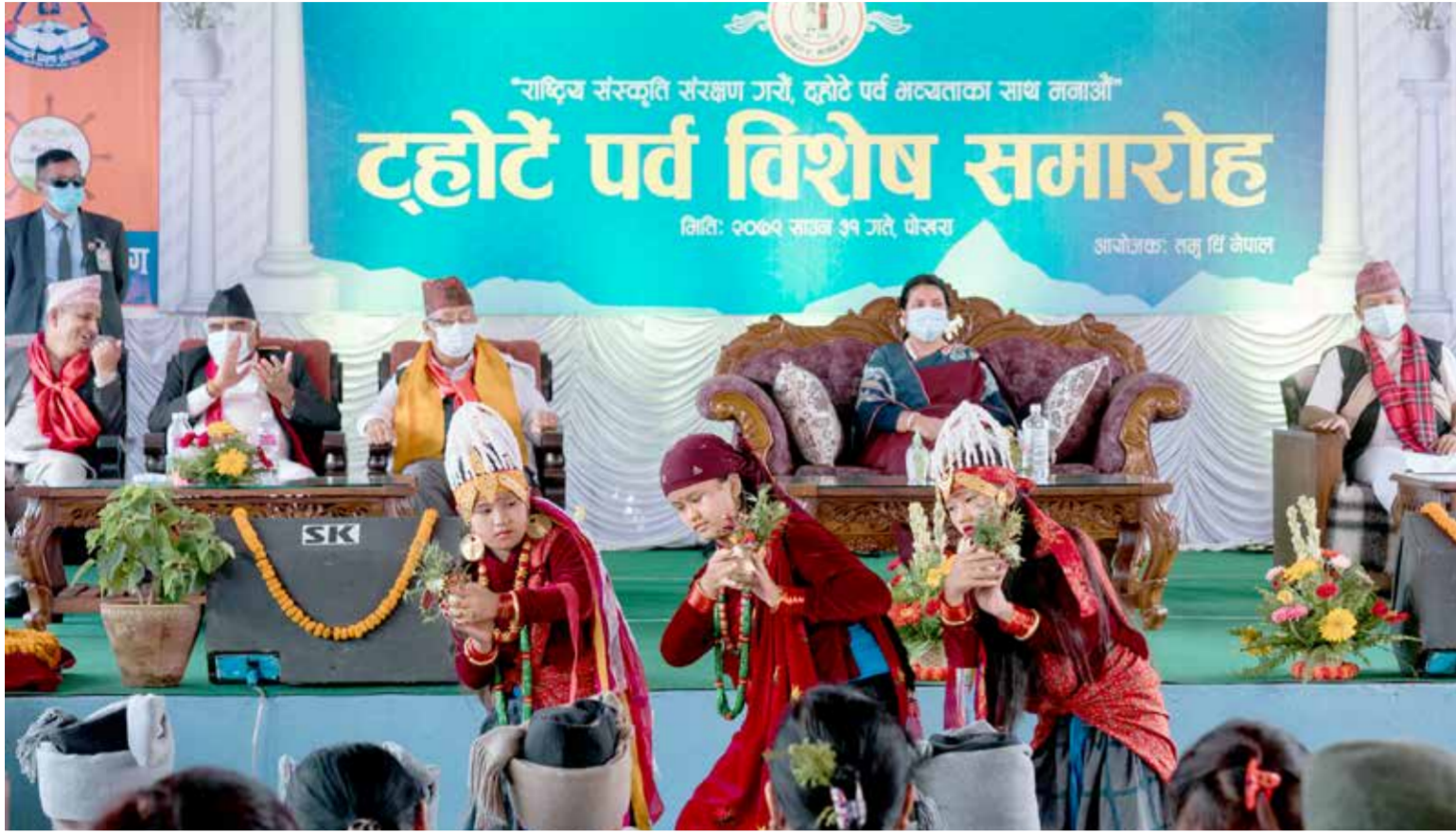
तमु धी नेपालले मंगलबार पोखरामा आयोजना गरेको कार्यक्रममा घाँटु नाँच प्रदर्शन गर्दै कलाकार।