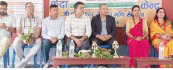
समाधान संवाददाता पोखरा, ३१ साउन

महिला पर्यटन व्यवसायी मन्त्र ओटेफले आफ्नो स्थापना दिवसको अवसरमा ज्येष्ठ नागरिक र बटुकलाई खाना खुवाएको छ । 'आर्थिक विकास लागि पर्यटन व्यवसायमा महिला' भन्ने उद्देश्यसहित स्थापना भएको संस्थाले पाँचौँ स्थापना दिवस पोखराको लेकसाइड स्थित केदारेश्वर मन्दिरमा मनाएको हो ।