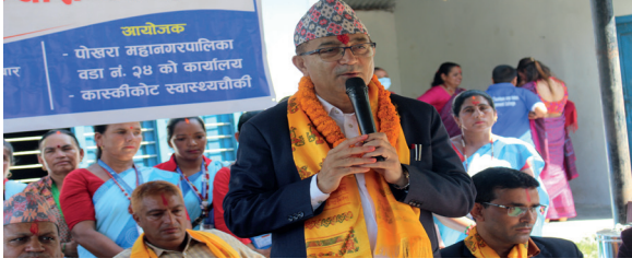
समाधान संवाददाता पोखरा, १ भदौ